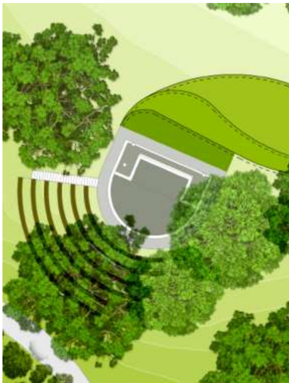
Obrázek nahoře a vlevo:

Vize do budoucna - vizualizace a situační zakres možné úpravy Plivátka v případě, že by městská část získala pozemek pod brouzdalištěm a nad ním do svého vlastnictví.